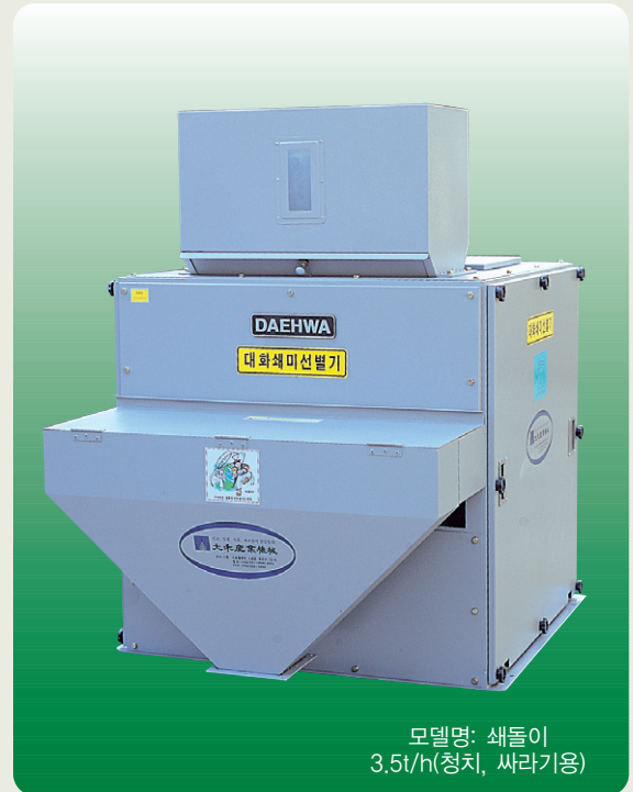
모델명: 쇄돌이 3.5t/h(청치, 싸라기용)